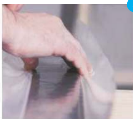
2. Raširiti Knauf MONTAPE® razdjelne trake.