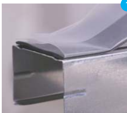
1. Nalijepiti po sredini UW/CW profila.