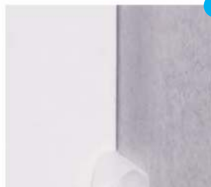
6. Nastaju savršeni spojevi u skladu s normom i pravilima proizvođača.

Knauf d.o.o. Tvornica Knin Uzdolje polje 91 22300 Knin, Hrvatska T +385 (0)22 688 500 F +385 (0)22 688 540 E info@knauf.hr www.knauf.hr