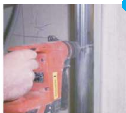
3. Pričvrstiti profil i postaviti gips ploču s fugom od 3 - 5 mm na profil.