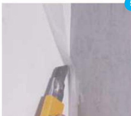
5. Odrezati Knauf MONTAPE® razdjelne trake.