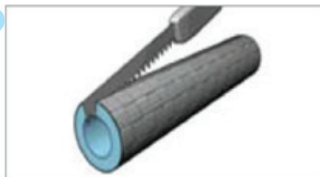
Otvoriti po dužini