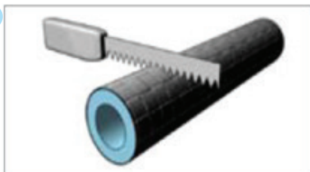
Odrezati na mjeru